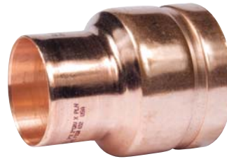
FIGURE 652 CONCENTRIC REDUCER GROOVE X CUP WROT COPPER