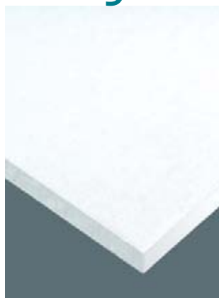
Calla de orilla cuadrada