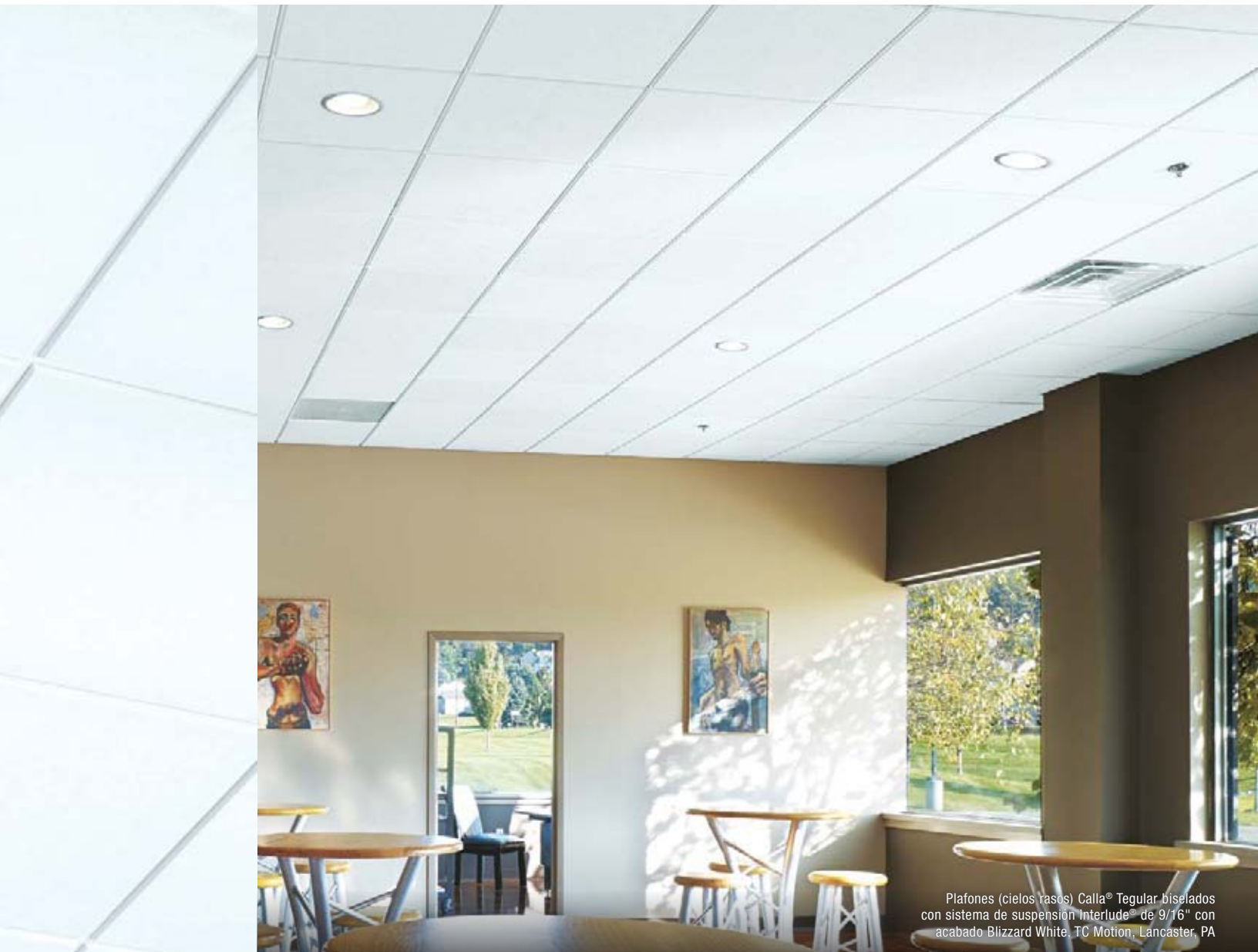
Plafones (cielos rasos) Calla® Tegular biselados con sistema de suspensión Interlude® de 9/16" con acabado Blizzard White. TC Motion, Lancaster, PA