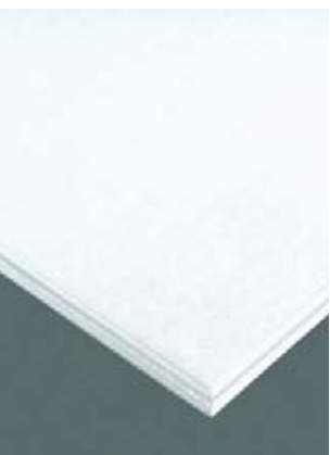
Calla Tegular biselado