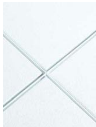
Calla Tegular biselado con sistema de suspensión Interlude® de 9/16" en acabado Blizzard White