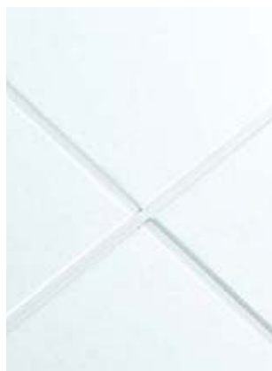
Calla Tegular biselado con sistema de suspensión Suprafine® de 9/16" en acabado Blizzard White