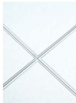
Calla Tegular biselado con sistema de suspensión Silhouette® XL® de 9/16" y ranura de 1/4" en acabado Blizzard White